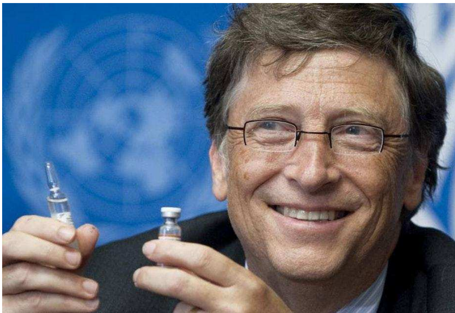
Obchodník s totální kontrolou – Ber vakcínu, dostaneš covidový pas! Bill Gates.

V důsledku to znamená, že očkovaná osoba nemůže onemocnět, že by padla do postele a v horečkách by blouznila, ale může prodělat lehkou formu nemoci, protože virus obsadí neobsazené buňky v organismu, kterých ale není v těle dost díky vakcíně. Takto očkovaná osoba je tedy chráněna proti těžkému průběhu nemoci, ale nechrání ostatní lidi, protože osoba je nakažlivá pro všechny neočkované osoby. A proto ty musí a budou muset do konce života nosit roušky. Takto nám lékař vysvětlil rozdíl mezi imunizační a rezistenční vakcinací, a je vám už teď doufám jasné, kolik uhodilo.