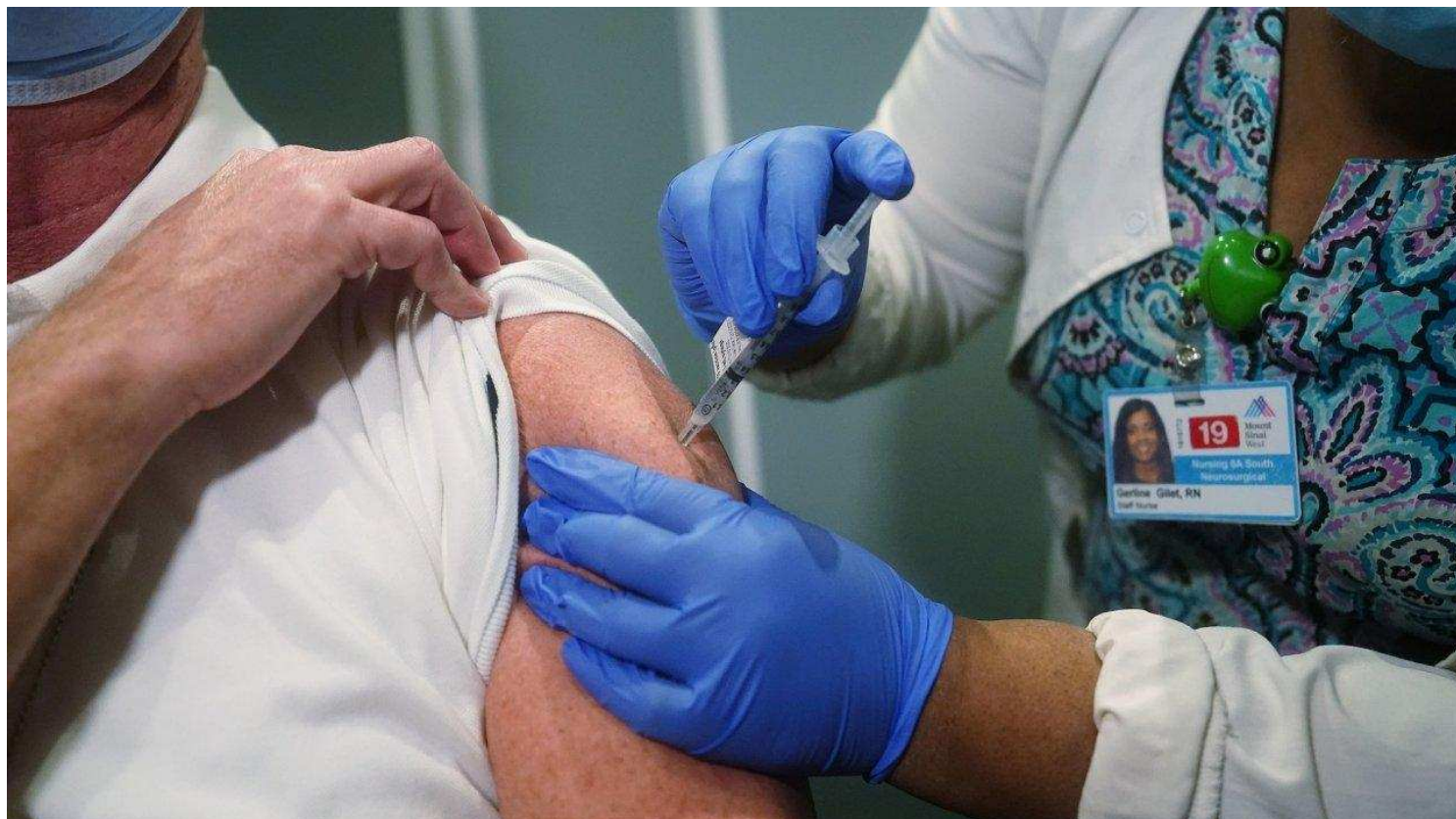
Očkování na covid poskytne podle všeho jen rezistenci, ne imunitu

A je to venku! Tak dlouho se o tom pouze spekovalo, konspirovalo, až to samotné ministerstvo zdravotnictví ČR potvrdilo jako pravdu. Přinášíme rozuzlení největší záhady, na kterou chtěli všichni znát odpověď, ale nikdy dosud nezazněla. Mnoho lidí si neustále kladlo pořád dokola otázku, jestli osoba, která se nechá očkovat, se skutečně stane imunní a pomůže tak zabránit šíření viru, protože to je právě druhou funkcí běžných vakcín. Vakcíny mají za úkol vytvořit v těle protilátky, které začnou likvidovat viry v organismu a postupně je všechny zničí, takže očkovaná osoba nejen ne onemocní, ale navíc přispěje k zamezení šíření viru v populaci. Taková je tradiční a veřejností očekávaná funkce vakcíny, že?